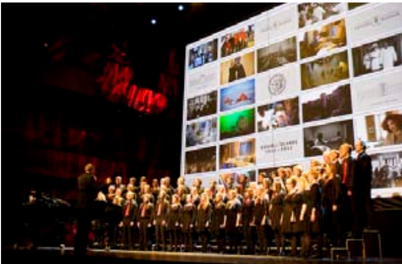
Háskólakór Háskóla Íslands