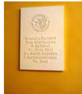
Alþingi Íslendinga veitti veggmynd viðtöku til minningar um starfsemi skólans í Alþingishúsinu 1911–1940.