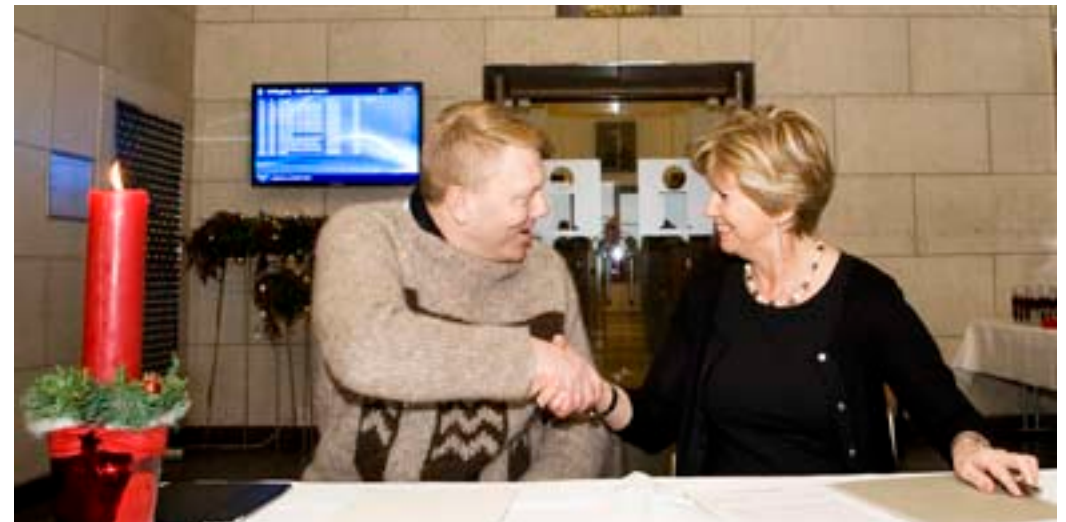
Jón Gnarr borgarstjóri og Kristín Ingólfssdóttir, rektor Háskóla Íslands, undirrituðu samkomulag um sameiginlega framtíðarsýn á háskólasvæðinu. Samkomulagið er byggt á yfirlýsingu borgarstjórnar í tilefni af 100 ára afmæli Háskóla Íslands í október 2011.